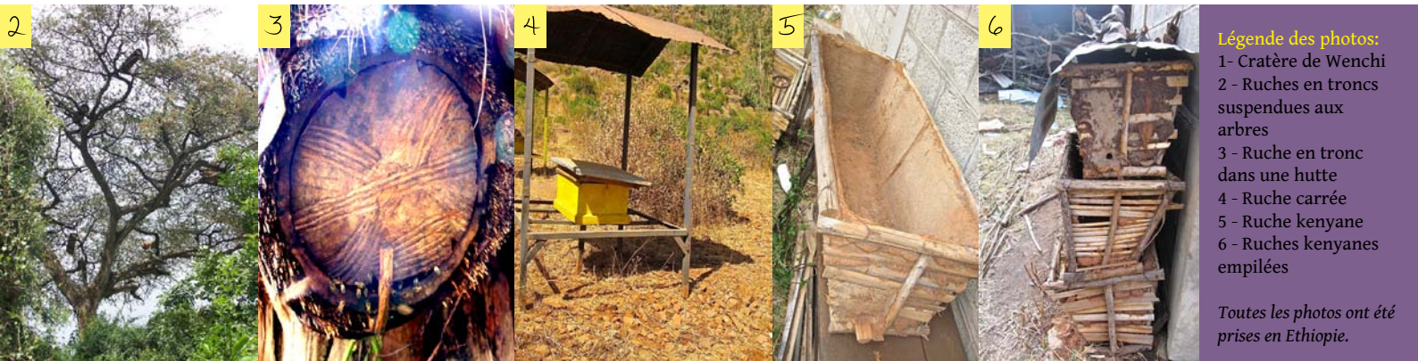
Légende des photos: 1 - Cratère de Wench 2 - Ruches en troncs suspendues aux arbres 3 - Ruche en tronc dans une hutte 4 - Ruche carrée 5 - Ruche kenyane 6 - Ruches kenyanes empilées Toutes les photos ont été prises en Ethiopie.

d'utilisation que les ruches en hauteur. En ce qui concerne le goût du miel, chaque éthiopien vous dira que celui de sa région est le meilleur ; le plus mis en valeur étant celui du Tigray, au Nord du pays. C'est un miel très blanc, doux et crémeux, issu d'une fleur appelée Djima. Les autres miels que nous avons pu déguster ont un goût fumé très prononcé, dont les éthiopiens raffolent, mais moins accessibles pour nos palais peu habitués. Nous pourrions vous faire déguster ces miels éthiopiens lors d'une miellée populaire (nous en avons ramené des kilos!).